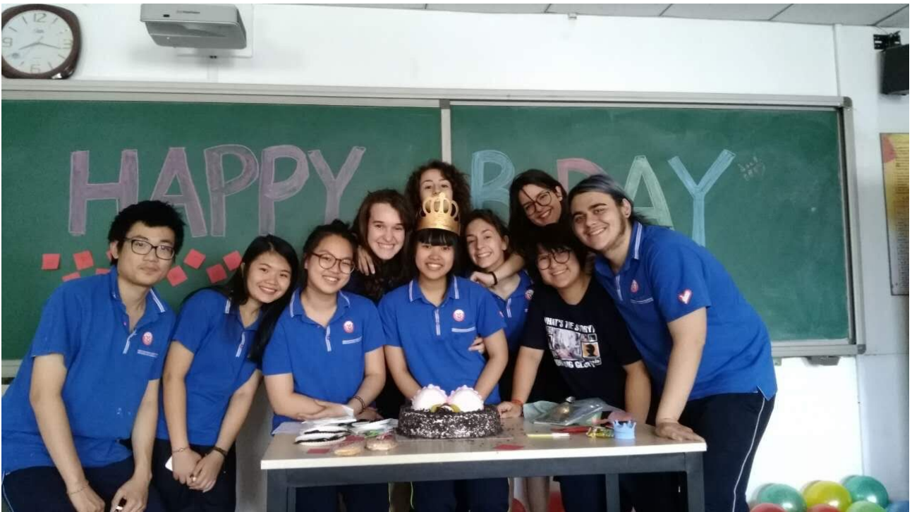
I nostri compleanni non potevano certamente rappresentare un momento per saltare la scuola, allora sfruttavamo i momenti di pausa per cercare di rendere speciali queste giornate!