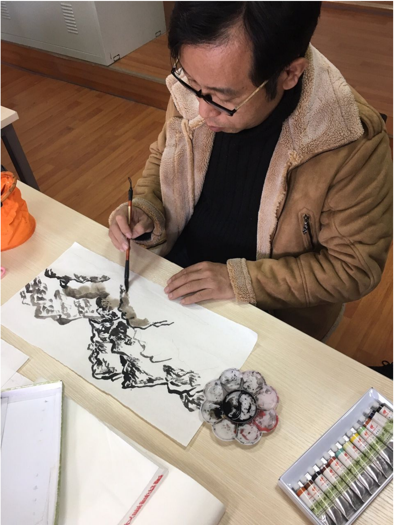
In una delle lezioni di cultura, abbiamo avuto modo di provare un tipico disegno cinese, con un vero artista