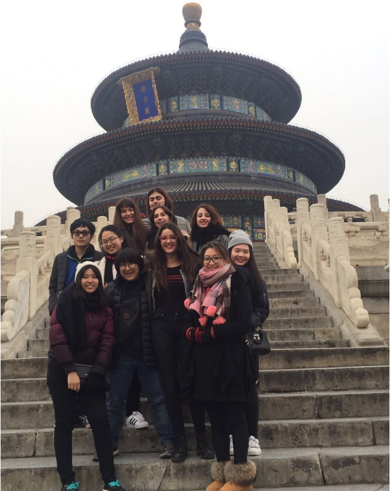
A Pechino mentre visitiamo il "temple of Heaven" con la classe internazionale.