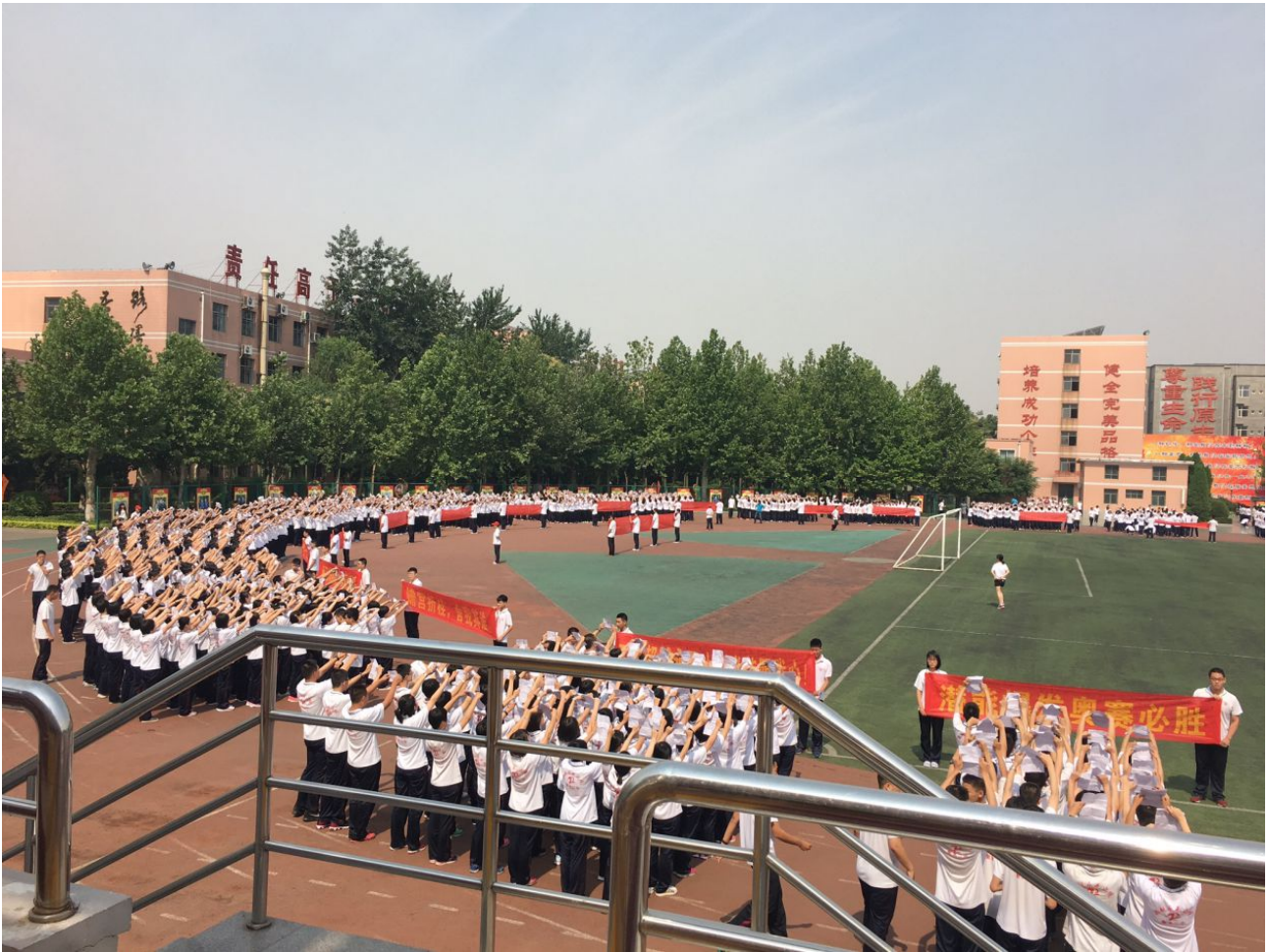
Questa foto ritrae il momento che precede la corsa mattutina